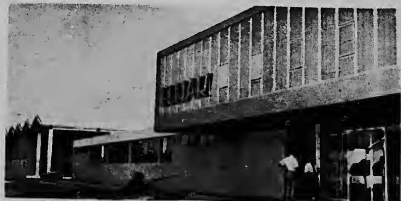
Un bista riba e parti dilanti di e edificio nobo y moderno di "Elmar" cual a keda inaugura oficialmente diamars atardi último.